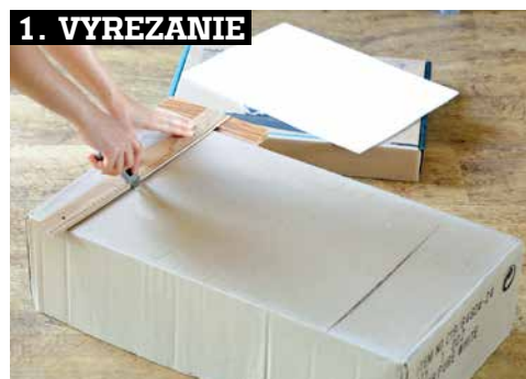
1. VYREZANIE Z kartónu vyrežeme obdĺžnik takého istého formátu, ako je vrchná strana škatule.