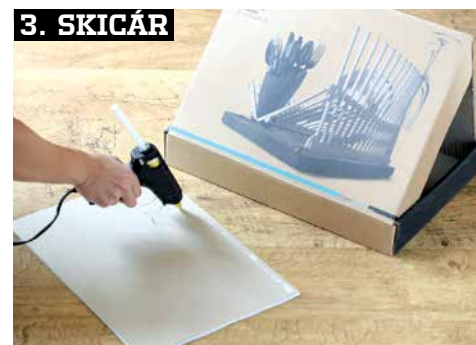
3. SKICÁR Lepidlo naniesieme aj na zadnú stranu skicára.