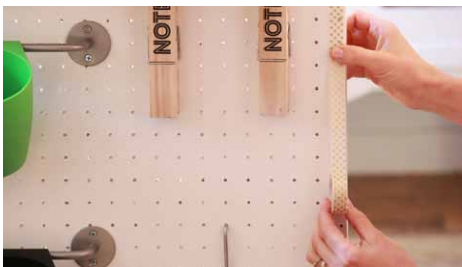
Okraje akulitu můžete oblepit washi páskou