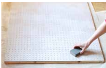
5 Po uschnutí přebrousíte jemnou brusnou houbičkou.