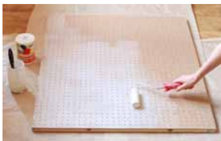
4 Potom akulitu napenetrujete bílou barvou zředěnou s vodou v poměru 1 : 1.