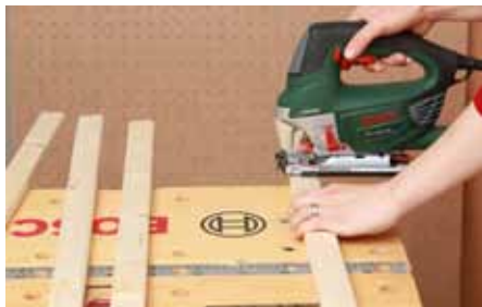
1 Dřevěné hranoly nařežete podle rozměrů akulitu, který nám odřízli na míru v obchodě.