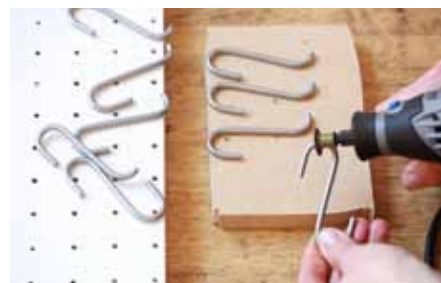
9 Háčky zkrátíte elektrickým nářadím, abyste je pohodlně mohli věšet do dírek.