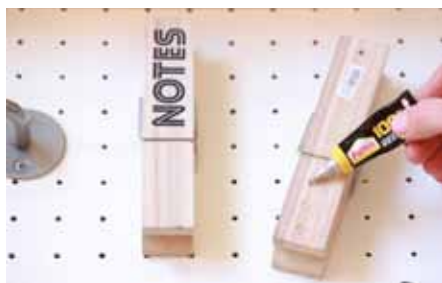
8 Velké kolíčky přilepíte lepidlem.