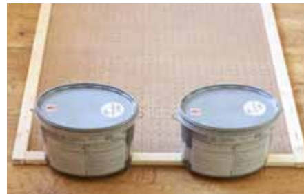
3 Lepidlo necháte 24 hodin vytvrdnout.