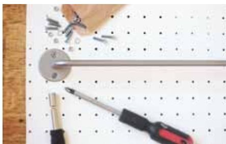
7 Na místa, kde chceme tyč, vyvrtáte do akulitu dírky, do kterých vložíte přes díry v tyči šroubky a zezadu je utáhnete matkami.